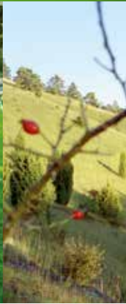
Flussgenuss an der Altmühl | Unterwegs mit Rad und Zelt | Gungoldinger Wacholderheide | Übernachtung direkt am Fluss

Wer auf den Campingplätzen im Naturpark Altmühltal ankommt, genießt gleich die entspannte und naturnahe Atmosphäre, die einen vor Ort empfängt.