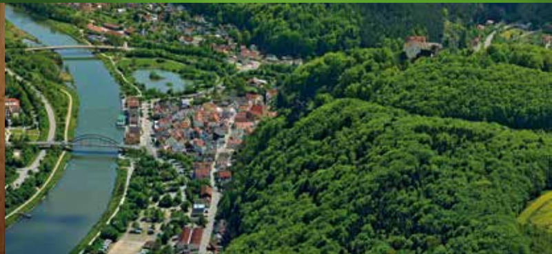
Riedenburg aus der Vogelperspektive