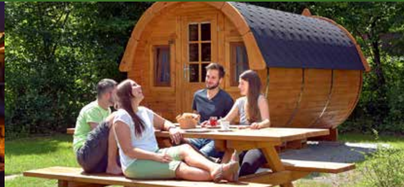
Campingfässer: ein außergewöhnliches Camperlebnis für bis zu vier Personen