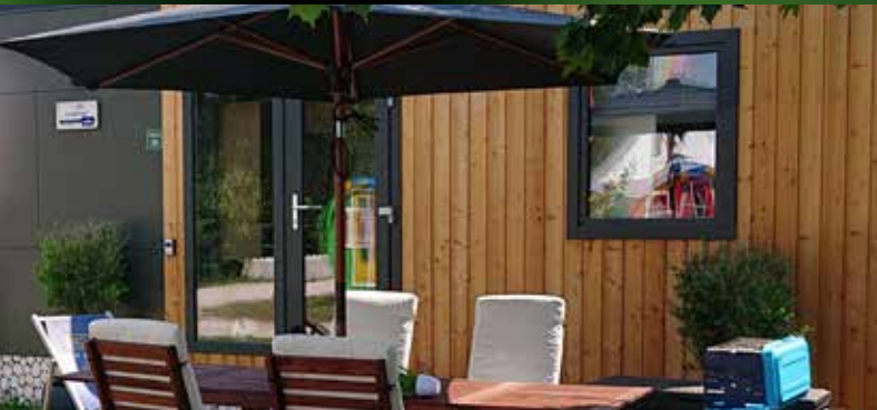
Tinyhaushotel direkt an der Altmühl