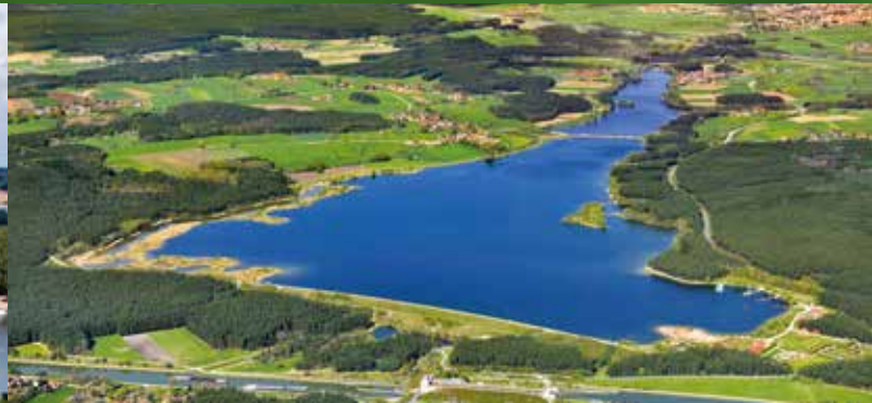
Wohnmobilstellplätze am Rothsee bei Hilpoltstein