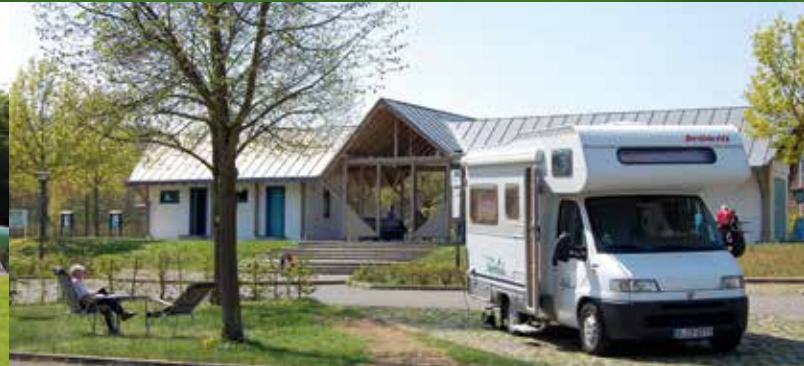
Auszeit auf dem Wohnmobilstellplatz an der Schiffsanlegestelle Berching