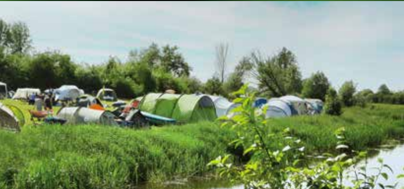
Zelten am See