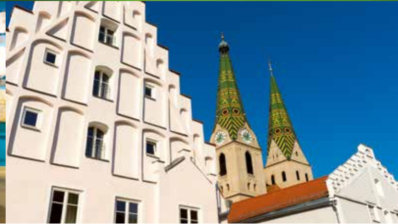
Zeitreise im Museum Solnhofen | Bunte Dachziegel schmücken die Stadtpfarrkirche St. Walburga in Beilngries | Schmackhafte Spezialitäten | Malerische Aussichten auf die Monheimer Alb

Davon überzeugt man sich beim Fossilien sammeln in den Besuchersteinbrüchen am besten selbst. Lebendig wird Erdgeschichte ebenfalls in zahlreichen Museen: zum Beispiel im „Museum Solnhofen“, im „Jura-Museum“ in Eichstätt oder im „Dinosaurier Museum Altmühltal“ in Denkendorf, das die Giganten der Urzeit in Lebensgröße auf einem barrierefreien Rundweg durch den Wald vorstellt. Im „RiesKraterMuseum“ in Nördlingen dreht sich hingegen alles um einen Meteoriteneinschlag. Eine Reise in die Vergangenheit