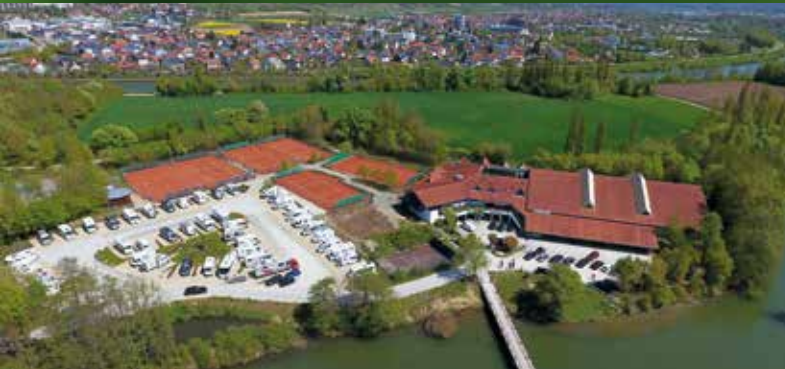
Wohnmobilstellplatz auf der Kelheimer Landzunge