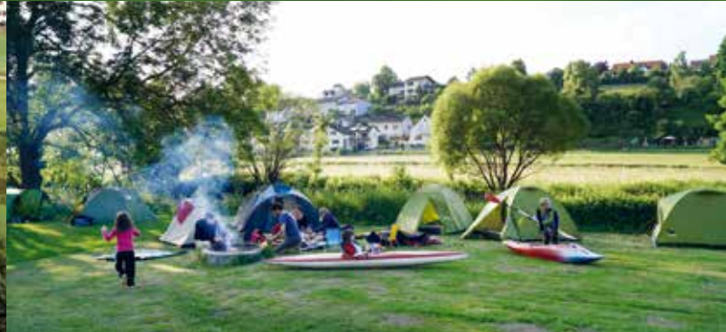
Naturnah zelten direkt an der Altmühl