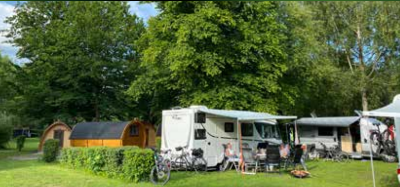
Schlaffässer auf dem Kipfenberger Campingplatz