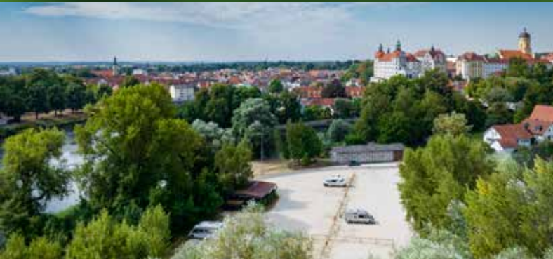
Wohnmobilstellplatz Schloßlwiese direkt an der Donau