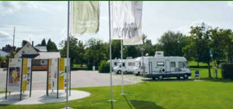
Stellplätze auf der Monheimer Alb