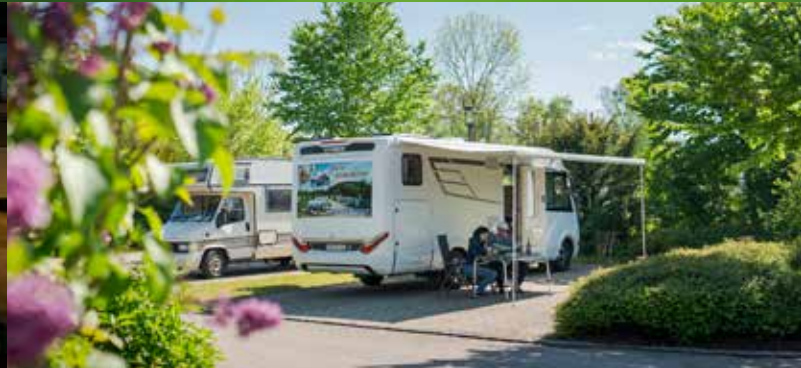
Stellplätze in der Nähe der Altmühltherme Treuchtlingen