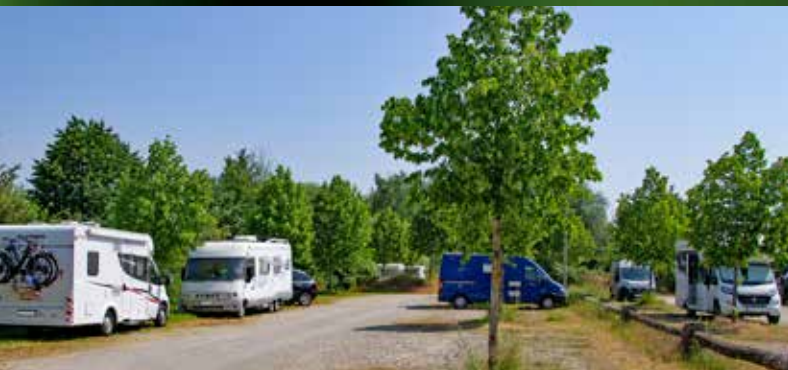
Wohnmobilstellplatz am Volksfestplatz