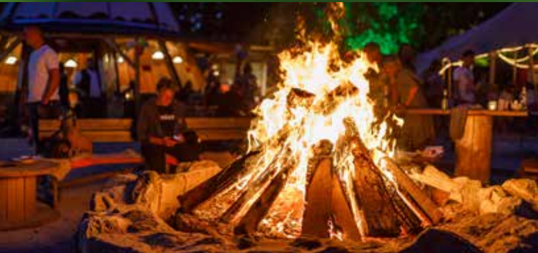
Lagerfeuer am SAN-shine-CAMP auf der Badehalbinsel Absberg