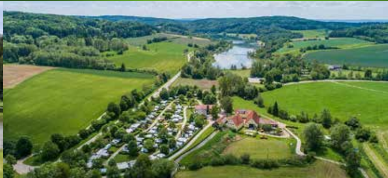
Campingplatz Hasenmühle, idyllisch am Hahnenkammsee gelegen