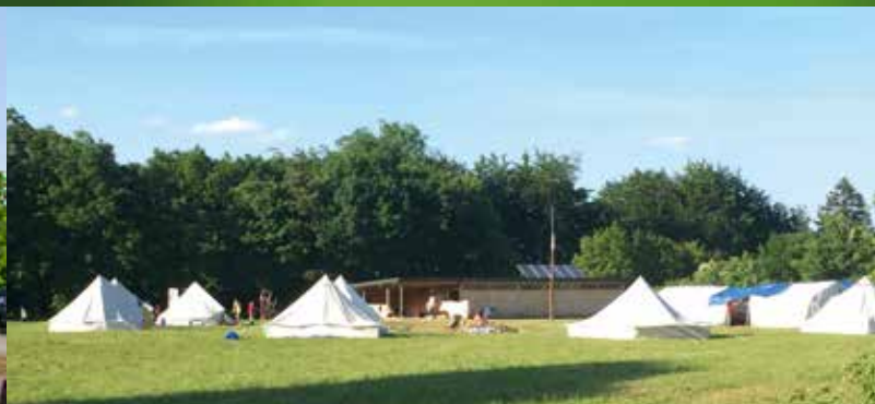
Jugendzeltplatz am Pfadfinderzentrum auf dem Mariahilfberg