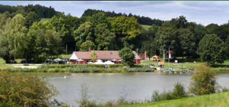
Der drei Kilometer lange Uferweg lädt zum Entdecken und Erleben ein