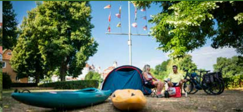
Campingplatz des Donau-Ruder-Clubs e.V.