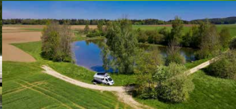
Am Zelt- und Wohnmobilstellplatz Eichstätt beginnen gemütliche Flusstouren