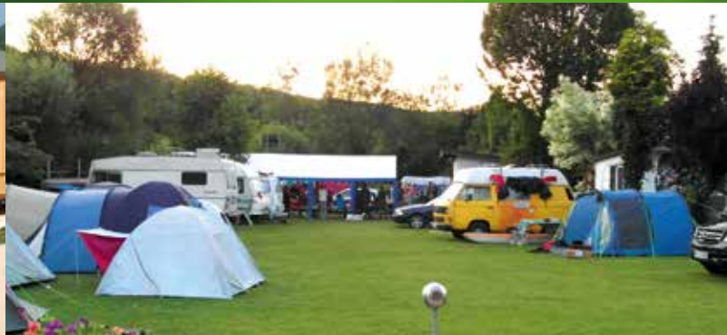
Idylle in Breitenfurt: der Zeltplatz direkt an der Altmühl