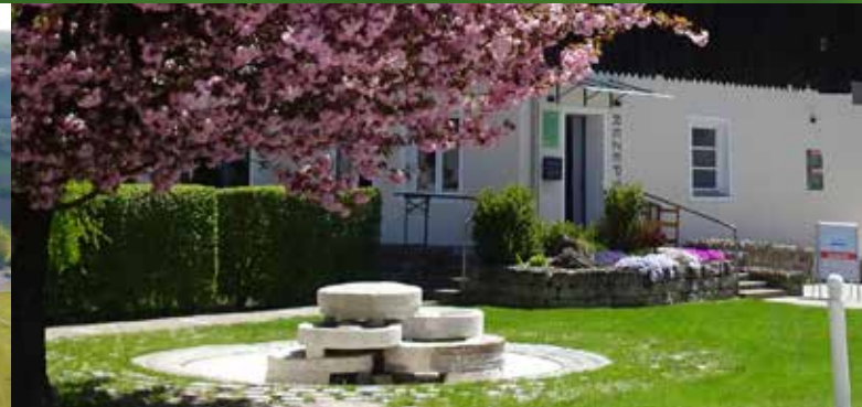
Wasserspiel vor der Anmeldung am Campingplatz Kratzmühle