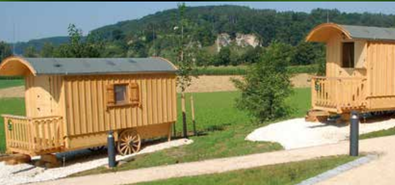
Schäferwagendorf bei Mörsheim