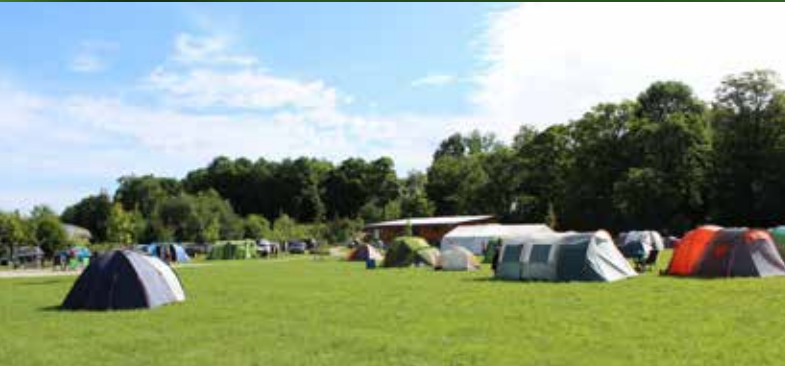
Der neue Grill- und Zeltplatz in Berching