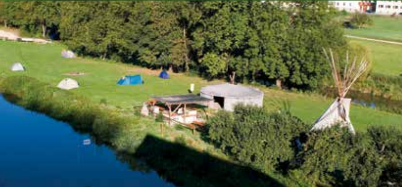
Überdachter Grillplatz auf der Campinginsel