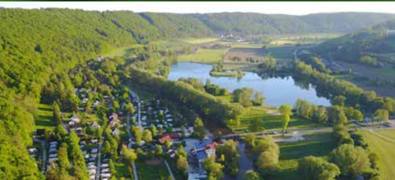
Campingplatz am Kratzmühlsee bei Kinding