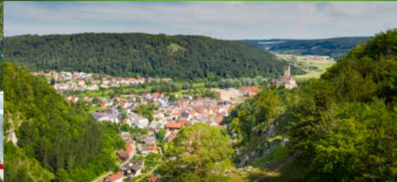
Herrliche Aussicht auf Kipfenberg